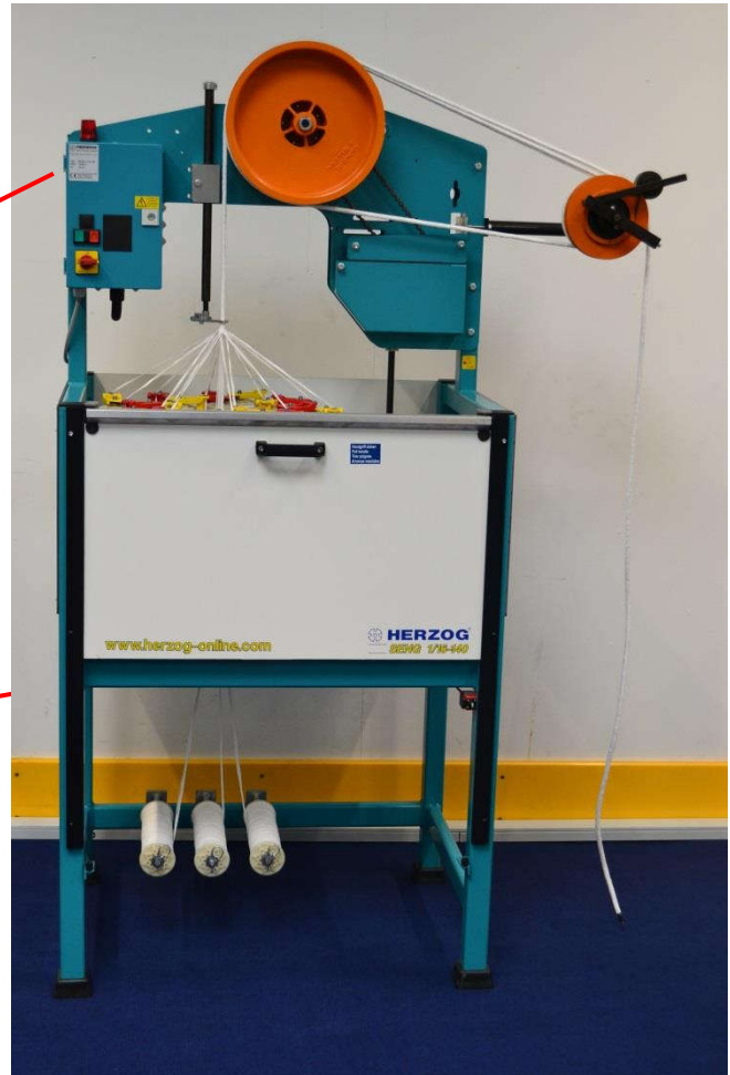
Fig. 9-3 Machine label

The machine number is also stamped in the upper plate of the machine.