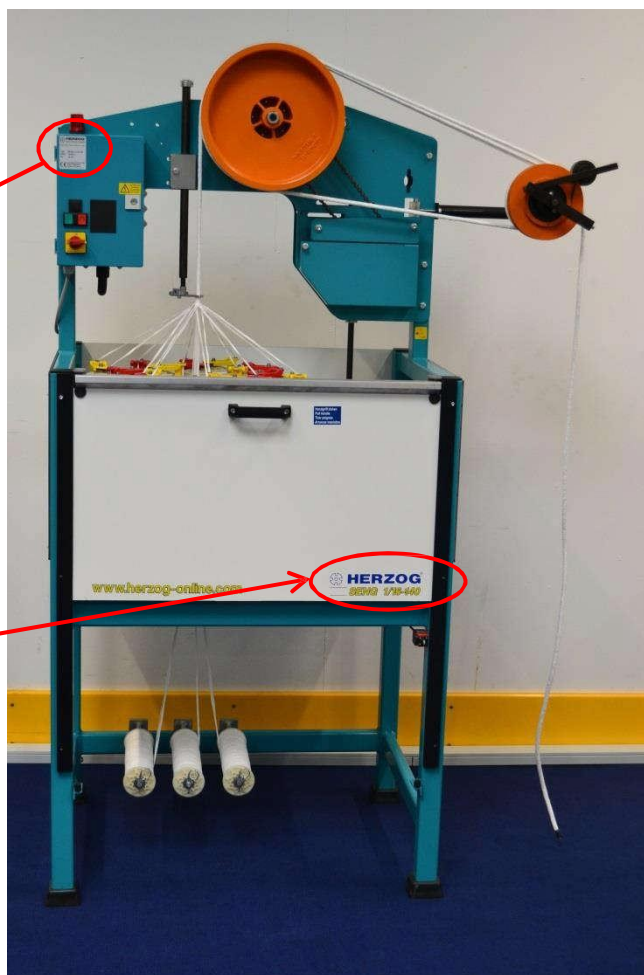
Fig. Identification de la machine

Le numéro de série est également gravé dans la plaque supérieure de la machine.