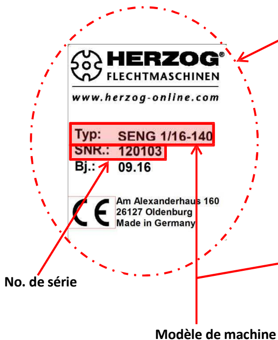
Fig. Plaque signalétique

Le numéro de série est également gravé dans la plaque supérieure de la machine.